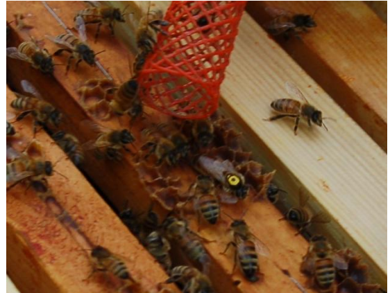
Teeltkoningin TR26 wordt in zesramer van Stichting Buckfast Marken ingevoerd

Er heeft zowel een goede als risico-vrije revitalisatie plaatsgevonden (minimaal 6 generaties selectie). In 2013 had ik voor bevruchting van de dochter van de B26(TR) wat meer "power" van de darrenlijn willen zien. Het opstellen van deze darrenlijn zal resulteren in eerste klas aanparingen. De vitaliteit wordt vastgehouden en de broedcapaciteit zal toenemen. Bovendien kunt u altijd volledig ontspannen werken met sterke volkeren.